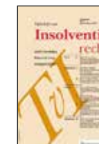
Tijdschrift voor Insolventierecht