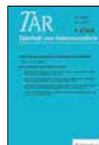
Tijdschrift voor Arbitrage