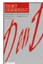
Delikt & Delinkwent